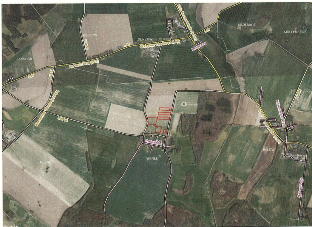
Gemarkungsgrenzen Basis: © Amt für Geoinformation und Vermessung der Länder Mecklenburg-Vorpommern, Niedersachsen, Brandenburg, Berlin, Sachsen-Anhalt, Sachsen, Thüringen; Geobasisdaten © GeoBasis-DE / BKG (2024). Nutzungsbedingungen: http://sg.geodatenzentrum.de/web_public/nutzungsbedingungen.pdf ; © GeoBasis-DE / BKG 2018 (Daten verändert); www.bkg.bund.de ; Lagekarte