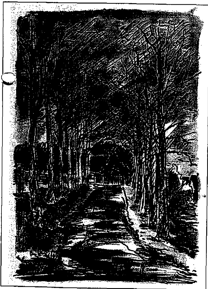
Grabow · Weg zur Trauerhalle · Grafik von W. Friebel