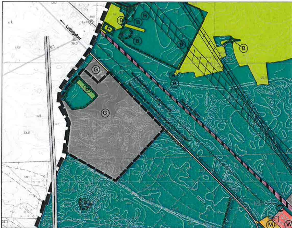
Auszug aus dem Flächennutzungsplan der Stadt Grabow (Stand 6. Änderung, 2020)