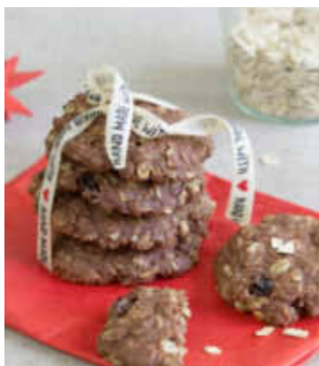
Hafer-Ingwer-Schoko-Cookies: Die gesunden Vollkornflocken mit ihrem leicht nussigen Aroma eignen sich gut für Gebäck und Kuchen.

(djd). Haferflocken können als Ersatz von einem Viertel bis Drittel der angegebenen Mehlmenge verwendet werden oder auch Nüsse ersetzen. Eine leckere Rezeptidee sind Hafer-Ingwer-Schoko-Cookies: Dafür den Backofen auf 180 °C (Umluft 160 °C) vorheizen. 1 Stück Ingwer (20 g) schälen und fein hacken. 100 g Kokosöl mit 100 g Kokosblütenzucker, 1 Prise Salz und je 1 Messerspitze Vanille- und Zimtpulver vermischen. 1 Ei unterrühren. Ingwer, 120 g kernige Haferflocken, 120 g Dinkel-Vollkornmehl, 1/2 TL Backpulver, 2 EL Kakaopulver und 20 g Rosinen unterheben und zu einem Teig verkneten. Aus dem Teig kleine Kugeln formen und auf mit Backpapier ausgelegte Backbleche setzen. Die Kugeln leicht flach drücken und im Ofen 10-15 Minuten backen. Weitere Infos gibt es auf www.alleskoerner.de .