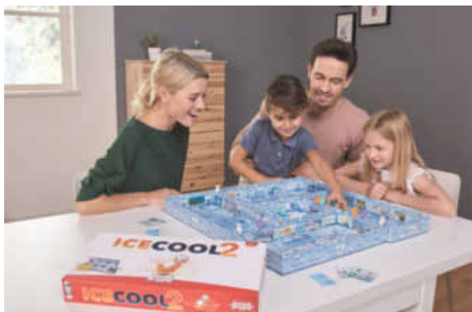
Große und kleine Spieler schnippen ihre Pinguinfiguren mit geschickten Fingern durch den 3-D-Spielplan.

Zwei bis vier Spieler ab sechs Jahren können sich auf vielseitigen Spielspaß freuen und auch ihre taktischen Fähigkeiten erproben. Wenn sie mit einem Sonderzug die Fische über den Türen umstecken, können sie zum Beispiel sich selbst in günstigere oder ihre Mitspieler in schwierigere Positionen bringen. Was „Icecool2“ aber so besonders macht, ist die Kombination mit dem Kinderspiel des Jahres 2017 „Icecool“. Mithilfe von fünf verschiedenen Bauplänen können die Schachtelboxen beider Spiele auf unterschiedliche Weise miteinander verbunden werden. So entsteht eine noch größere Spiel- und Rutschfläche. Verschiebbare Räume sorgen zudem für taktische Finesse. So ergeben sich noch mehr Möglichkeiten und ein neues Spielsystem: „Das große Rennen“. Dabei treten die Spieler in Teams mit- und gegeneinander an, um sich alle Fische zu schnappen.