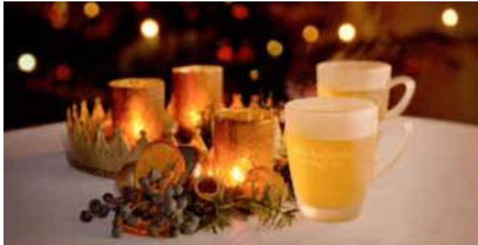
Für sein Wintergetränk hat Schloss Wackerbarth das historische Rezept des Raugrafen von 1834 behutsam an den heutigen Geschmack angepasst.