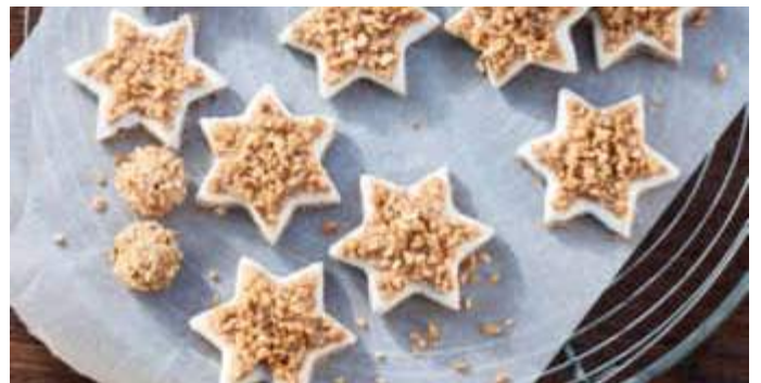
Wie das duftet - Zimtsterne sind ein unverzichtbarer Klassiker!

Die Zubereitungszeit beträgt rund 50 Minuten, die Backzeit circa 2-mal 15 bis 20 Minuten. Pro Stück enthalten die Zimtsterne rund 84 kcal, 1,4 Gramm Eiweiß, 5,3 Gramm Fett, 7,1 Gramm Kohlenhydrate und 0,5 Proteineinheit