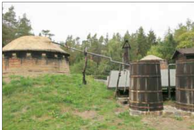
Die Teerschmelöfen von Wiethagen

Vorbei am Ruheforst und dem Forstamt steuerte die Gruppe den Köhlerhof Wiethagen an. Hier genoss man zunächst Kaffee und Kuchen, um dann später den historischen Hof mit seinen sehenswerten funktionsfähigen Teerschmelöfen und musealen Besonderheiten noch auf eigene Faust zu erkunden.