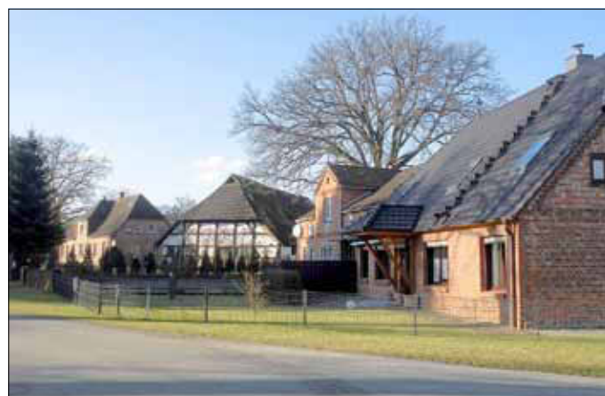
Stuck, ein Teil des Rundlings