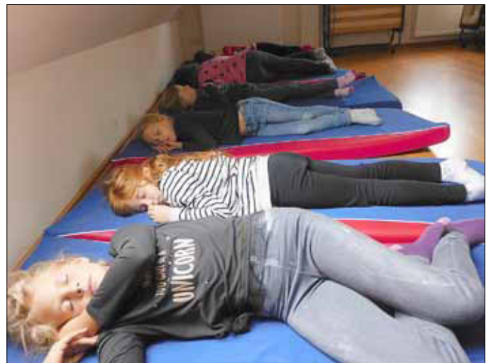
Die Kinder liegen und lauschen der leisen Musik und der Phantasiereise, die ich dazu erzähle.

In den letzten Jahren hat sich die Lebens- und Erlebniswelt von Kindern erheblich verändert. Schon Grundschulkindern haben häufig prallvolle Terminkalender. Der elterliche Fahrdienst bringt sie zur Schule, zum Sport, zum Reiten, zur Feuerwehr usw. Da tut es gut, wenn sie sich einmal den eigenen Sinnen anvertrauen können. Kinder lernen - Stille zu genießen. Über die sinnliche Wahrnehmung, wie das Hören oder Fühlen, werden Kinder ganz von alleine still und konzentriert, sie haben auch noch Spaß dabei.