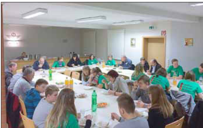
Die Zeit für eine kleine Stärkung wurde gut genutzt.

Der Bus selbst bot jede Menge Fenster- und Deckenfläche, auf der wir unsere Arbeitsergebnisse präsentieren und sich die Fahrgäste während unseres Zwischenstops bei der Muchower Jugendinitiative, wo es leckere selbstgemachte Suppen und Brote gab, informieren konnten.